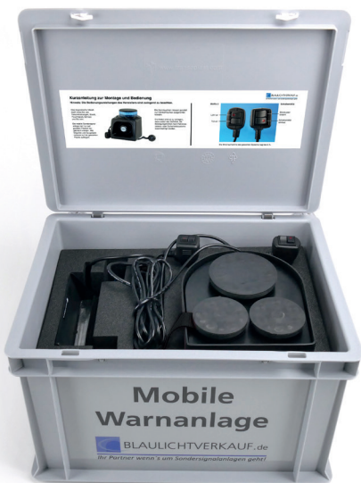
Koffer für Mobile Warnanlage MoWa 2-BT