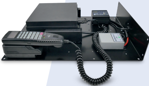
Analogfunkboard, Teledux 9