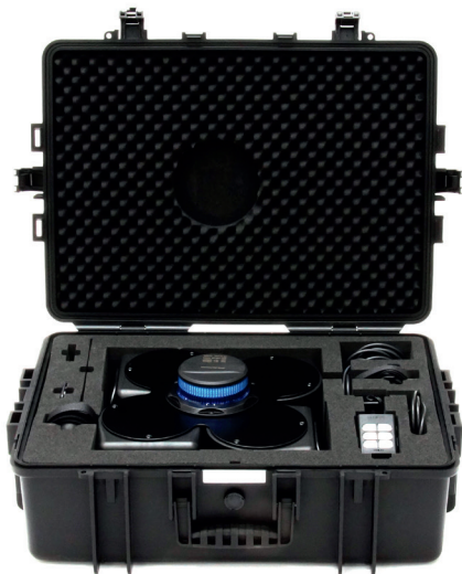
Koffer für Mobile Warnanlage MoWa 2-BT 360

Alle mobilen Warnanlagen auch erhältlich im praktischen Transportkoffer