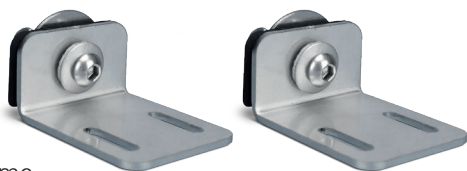
Befestigungssysteme (auch für T5/T6 C-Schiene möglich)