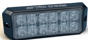
LED-Heckwarnsystem, horizontal MiniStealth MS26, Axitech